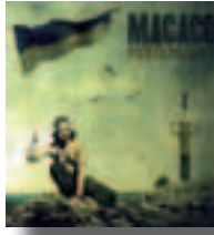
Mensajes del agua (Macaco)

Y un avioncito, y un bombardeo, y el que la forma solamente mueve un deo. Vence la fuerza y no, no la razón. Ninguno arregla nada, y los dos causan dolor, dolor, pero tú tranquilo hermano que no pasa ná quédate a gusto y sentáito en tu sofá mientras en el mundo sobra dolor.