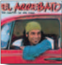
Mucha gente (El Arrebató)

A la patera se agarrará: en la otra orilla le juraron libertad. Morir ahogado no importa ya, subir a cambio de una posibilidad.