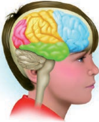
Figura 1. LA CAUSA PRIMARIA DE LOS TRASTORNOS

La causa primaria de los trastornos del desarrollo y el aprendizaje está en una disfunción del cerebro.