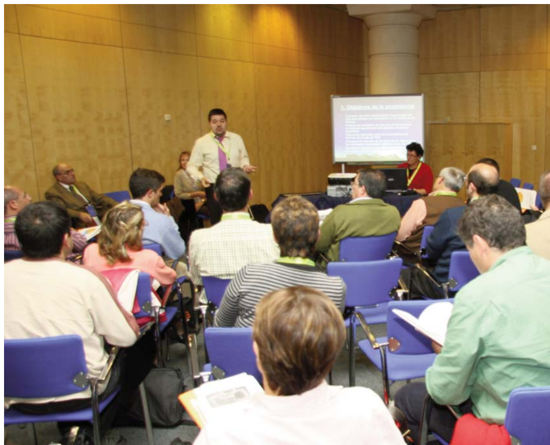
Los asistentes al Encuentro fueron rotando por cada una de las cinco zonas en las que se dividió la sala y en las que una serie de ponentes abordaba un asunto concreto.

Los galardonados en el III Premio a la Innovación Pedagógica pudieron dar a conocer en la zona 3 cada una de las experiencias rea-